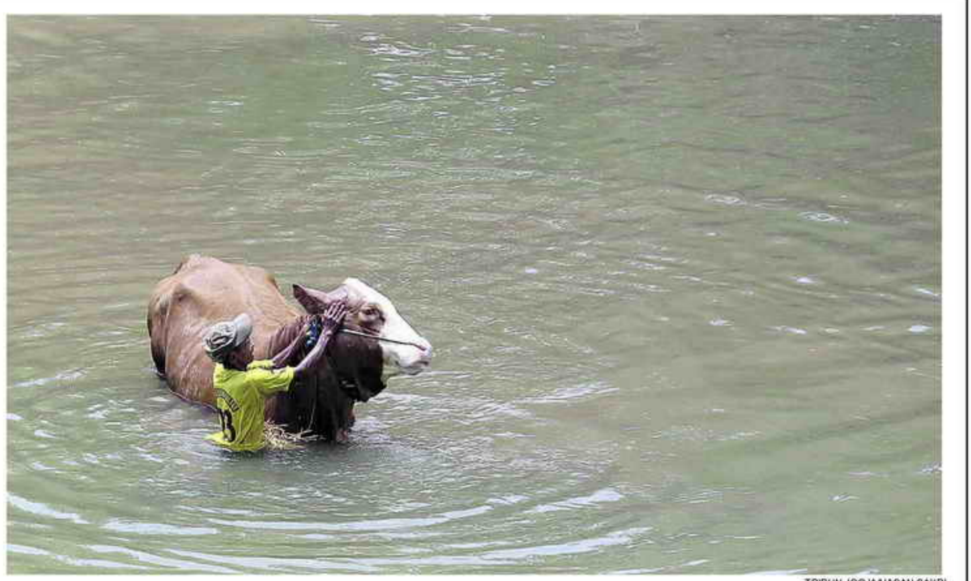
MANDI - Warga memandikan sapi di aliran Kali Oyo di Imogiri, Bantul, Minggu (15/11). Menjaga kebersihan akan berpengaruh terhadap perkembangan dan kesehatan hewan ternak.